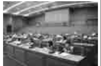
柏一小2年生、生活科の授業で(10月26日)