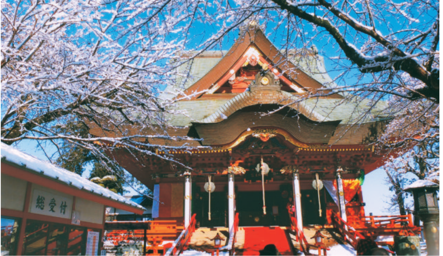
雪晴れの朝 (布施弁天)

発行：柏市議会 編集：議会広報委員会 〒277-8505 千葉県柏市柏5-10-1 議会事務局 ☎ 04-7167-1451 FAX 04-7167-0698