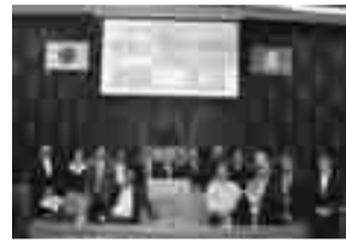
マレーシアからは研修で来柏 (10月16日)

他市からの視察だけでなく、海外からの訪問や市内の小中学校などの見学も受け入れています。