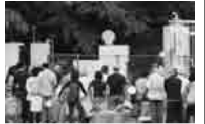
断水時の反省点を今後どう生かすか

アミューゼ柏条例及び柏市近隣センタ一条例の一部改正などについて、活発な議論が行われました。一般質問では、5月に発生した断水の対応について議論が集中しました。招集日散会後には、各常任委員会副委員長から行政視察について報告がありました。