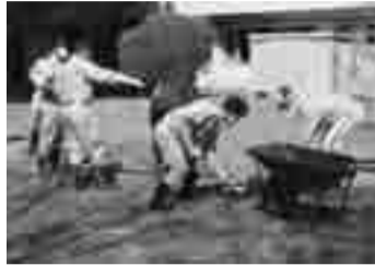
除染等の経費は国庫で措置を

24年度の一般会計予算を初め、暴力団排除条例の制定、敬老祝金支給条例の一部改正などについて活発な議論が行われました。さらに、議員提出議案として提出された「汚染状況重点調査地域で行われる除染等に対する国庫補助の拡充等を求める意見書」を可決しました。