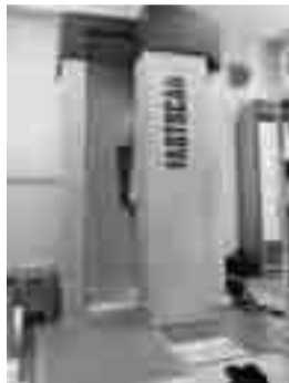
安心被曝検査費用を助成に

招集日に正副議長選挙、各委員会の正副委員長互選等が行われ、新体制で審議が行われました。内部被曝検査費用助成を含む一般会計補正予算などについて活発な議論が行われました。決算3議案は継続審査となりました。(決算審査特別委員会は閉会中の10月、11月に6回の審査を行いました)