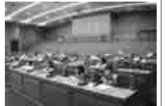
柏一小2年生、生活科の授業で(10月26日)