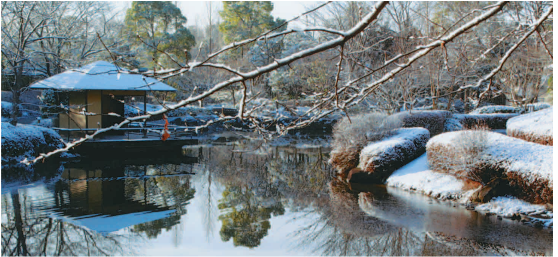
雪の庭園（柏の葉公園）

発行：柏市議会 編集：議会広報委員会 〒277-8505 千葉県柏市柏5-10-1 議会事務局 ☎ 04-7167-1451 FAX 04-7167-0698