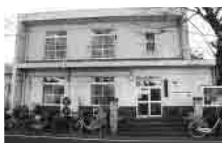
千代田近隣センター

答 昨年度以降、実施に至 った事業はない。その理由とし て、市民団体と市の理解不足 が原因と認識している。今 後は制度の見直しではなく、 市民団体と市との相互理解の 場の設定、あるいは市政情報 の提供などが必要と考える。