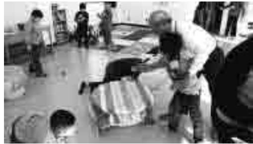
子育て支援事業(しこだ児童センター)

答 特殊歯科診療について、 22年度の年間収入は合計で2 328万4000円を見込んで いる。年間の延べ利用者とし て、障害のある方で708 人、高齢者で296人、外科