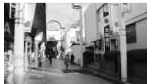
新中央図書館建設候補地(柏駅東口D街区)

問 子育て支援として県も進 めている乳幼児医療費助成の 対象年齢拡大について、新年 度予算に反映させる考えは、