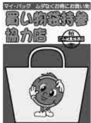
買い物袋持参協力店ステッカー

このことで、より安定的かつ継続的な製造と卸売価格の低減が図られ、市民の負担が少しでも減るよう期待している。今後さらなる分別の徹底を図るため、市民に理解・協力を求めていきたい。