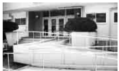
バリアフリー化された投票所(酒井根小学校体育館)

た、バリアフリー対策を講ずる順番等については、今後関係部署と協議しながら決めていく。