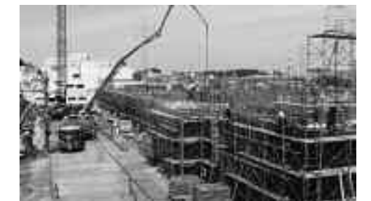
建設中の総合保健医療福祉施設

答 開所から2年目には、利用者数も安定してくるものと考えているが、黒字になるのは難しい。1000万円程度の収入不足になると予想しており、不足分は市が補てんしていく予定である。利用の周知を図り、潜在的な市民ニーズにこたえることにより、利用者の増が図られるものと考えている。