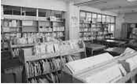
学校図書館 (柏一小)

問 小中学校では、読書率の向上のためさまざまな取り組みを行っているが、司書教諭の免許を持つ先生がいても、担任を担ったり行事で忙しいため、休み時間に図書館のかがかかっているといった状況がある。全小中学校に専任の司書教諭を配置すべきでは。 答 学校に常時専任の司書教諭がいて、図書館がいつもあいている環境が望ましいが、現在専任の司書教諭の配置は