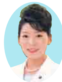
柏市議会議長 えびはら ひさえ 海老原 久恵