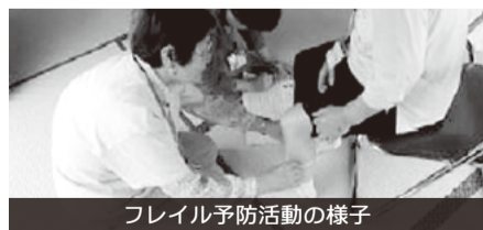
フレイル予防活動の様子

A 今後も民生委員や地域包括支援センターと連携を図り、適切な支援を行う。継続した情報発信と、介護予防センター事業や地域の通いの場の活動等、感染予防に配慮しフレイル予防の取組を進める。