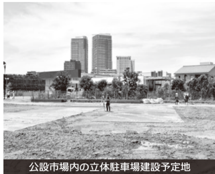
公設市場内の立体駐車場建設予定地

が落札決定まで知りえない仕組みになっている。電子入札手続に関わる情報の秘匿性から一定の競争性が確保されていると考える。