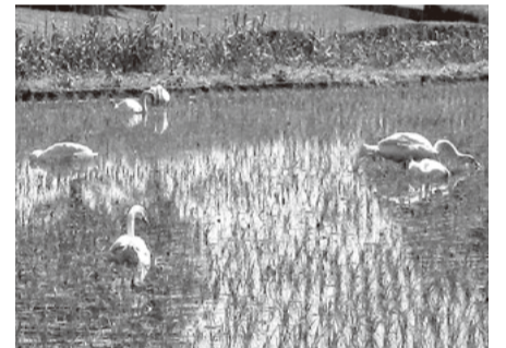
手賀沼周辺の水田を荒らすコブハクチョウ

A コブハクチョウは外来種の鳥類で手賀沼に定着しており、その個体数も年々増加傾向にある。手賀沼周辺の農作物に深刻な被害が生じている状況である。その対策の必要性を強く認識している。餌づけの防止を考えると同時に、餌づけに対する注意看板の設置なども含めた包括的な抑制策や農作物の被害に対する支援策の検討、実施について引き続き千葉県や関係自治体、関係者と情報を共有し、協力を求めつつ進めていく。