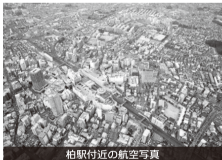
柏駅付近の航空写真

Q 東京都は再開発や区画整理など、未着手、一時停止が可能な事業の延期、中止を通過した。本市もこういう方針を示すべきではないか。 A 環境変化には慎重に対応しなければならない。今の時点で凍結はやり過ぎである。