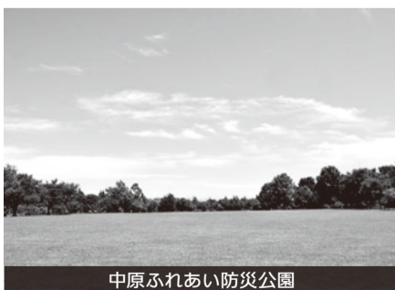
中原ふれあい防災公園

特色から新ライフスタイル時代に選好される公園の姿が見えてくる。平たんて広い空が見渡せるオープンスカイの公園を市民は求めている。本市の南部にはこのような公園が少ない。大津川の土手をウォーキングやジョギングのできるものに整備してほしい。大津川の両サイドは広い水田だから景観を楽しむためには並木は必要ない。大津川の土手は狭いがジョギングのできる道にしていきたい。 A 大津川については緑の基本計画において、自然環境に配慮した散策路などを整備することとしている。現在浸水被害の解消を目的とした改修工事が行われており、その後大堀川や手賀沼沿いの緑道と一体となった広域のネットワークとしての活用が期待されている。具体的な計画の策定に向けて関係部署を調整してまいりたい。