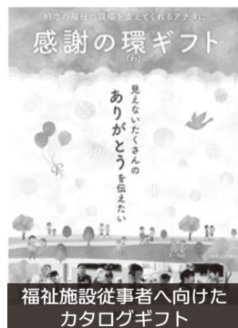
福祉施設従事者へ向けたカタログギフト