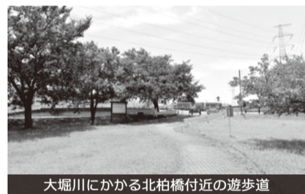
大堀川にかかる北柏橋付近の遊歩道