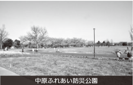
中原ふれあい防災公園

防災公園の在り方 Q 防災公園の目的・使用方法について周知活動をすべきと考えるがいかかか。 A 市民の防災意識向上につながるよう地域と連携を図っていききたい。