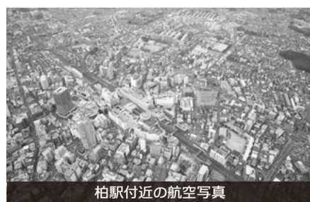
柏駅付近の航空写真

考える。東口商業施設については、引き続き、再活用に向けた働きかけと支援を行っていく。