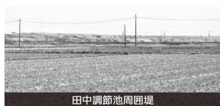
田中調節池周囲堤

A 本年1月、国土交通省利根川上流河川事務所に田中調節池周囲堤のかさ上げ状況を確認した。同省が平成25年に作成した整備計画では、田中調節池周囲堤をかさ上げし、現況の20%に当たる約1,000万 3 m程度の容量拡大を行う計画はあるものの、具体的な時期は未定である。東花野井町会の箇所においても、水防上最も重要な区間であることは公表されており、堤防高を現況より1m以上高くする計画が記されている。堤防自体の強度を増すために幅を広げる必要があり、本市の協力は欠かせない。今後、国と綿密に情報交換を図り、かさ上げ整備の早期実現に向け国に働きかける。