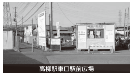
高柳駅東口駅前広場