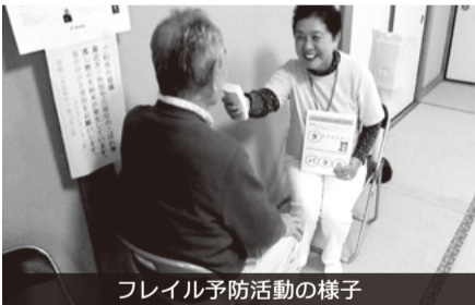
フレイル予防活動の様子

具体的な重点施策は、重点目標1「教育・子育て関連」では、教育環境の充実として学ぶ意欲と習慣を身につけることを目指し、サポート教員の配置等を行う。保育環境の充実では、待機児童の解消や保育士の確保に向けた取組を進める。重点目標2「健康・高齢者等福祉関連」では、気軽に楽しみながら健康づくりに取り組めるまちを目指し、フレイル予防活動やボランティア活動等への参加でポイントがたまるかしわフレイル予防ポイント制度を開始する。重点目標3「地域活性化関連」では、オリンピックの聖火リレーや車いすテニスのイギリス選手団との交流等を通じて、オリンピック・パラリンピック開催の機運醸成やにぎわいの創出を図るほか、手賀の丘公園の魅力向上のため、民間事業者による管理運営を開始するとともに、老朽化した設備の改修などを行う。