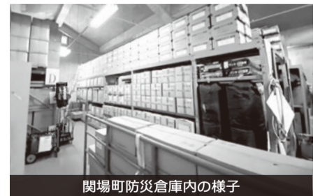
関場町防災倉庫内の様子

A 各避難所に1台あり、備蓄倉庫と合わせると284台所有している。燃料については石油組合との協定を結んでおり、台風等の被害が想定される際は、早めの燃料確保に努めている。