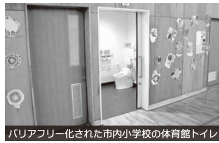
バリアフリー化された市内小学校の体育館トイレ

ある。長寿命化工事において整備を進める。エアコン設置は重要な課題だと認識しているが、現時点での設置は難しい。