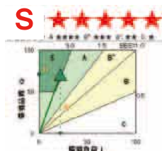
CASBEE 柏は、建築物の環境効率を5段階のランキングで表示します。