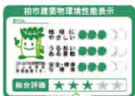
マンション用表示ラベル