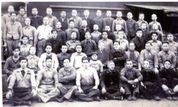
▲従業員たちと合板工場の前で

のころ知り合ったのが、思想面で影響を受けた浄土宗の僧侶友松円諦(ともまつえんたい)の弟子であり、後に日本医師会長として活躍する武見太郎です。やがて二人は、田中村(現柏市高田)に移りました。空襲で家を焼かれた牧野伸顕が武見を頼り、木方の家に疎開したのは前号の通りです。伸顕が借りた「明香庵」は、昭和16年敬一が隠居場として建設したもので、戦時中にもかかわらず、