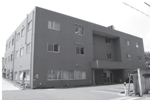
▲地域生活支援拠点しょうなん