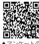
▲アンケートの回答はこちら

☎7月13日(金)までに、はがきに住所・氏名(ふりがな)とアンケートの回答を書いて、〒277-8505 柏市役所広報広聴課へ郵送(当日消印有効)するか市のホームページで※1人につき1回まで。当選の発表はプレゼントの発送をもって代えさせていただきます