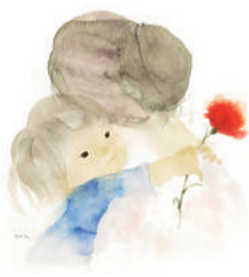
いわさきちひろ 「母の日」1972年