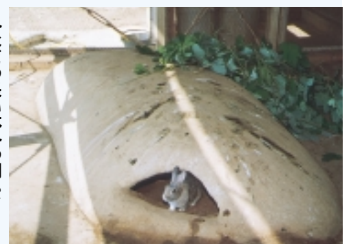
おなかすいたのかな？

二逆井小には、クジャク一羽・アヒル一羽・ウサギ十五羽が一つの小屋に同居しています。この特徴はコンクリート製の屋根付き隠れ家です。PTAの好意で造られたもので、中には土が敷いてあり、動物たちには夏の暑さをも冷たい雨もしのげる快適な環境になっています。この日もアヒルとウサギたちはこの隠れ家にとまっていた。食事のときだけ出てきて、食べ終わるとサッと穴に入ります。よほどお気に入りなんです。