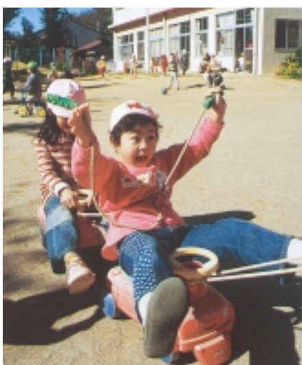
みんなで楽しく元気に遊ぼう

来月4月から市内の保育園(別表1参照)に入園を希望するお子さんの申し込みを、12月2日(月)から受け付けます。保育園はいろいろ理由により家庭で十分に保育できないお子さんを保育する児童福祉施設です。