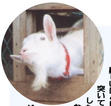
「メーメー」と元気な声を出しているのは、ヤギの「メリー」さん。九年前に近くの牧場から赤ちゃんの状態です。当時はまだ小さかったのですが、お母さんが首輪を付けてお散歩したり、校庭に設置した囲いの中で遊んだりしていたそうです。

今では体も大きくなって大人でも引張るのが難しいほどに成長。すきを突いて校庭をメーメー走りしたり、大好きなラビットフードを追ってウサギ小屋に忍び込んだり、とわがやが得意なようです。