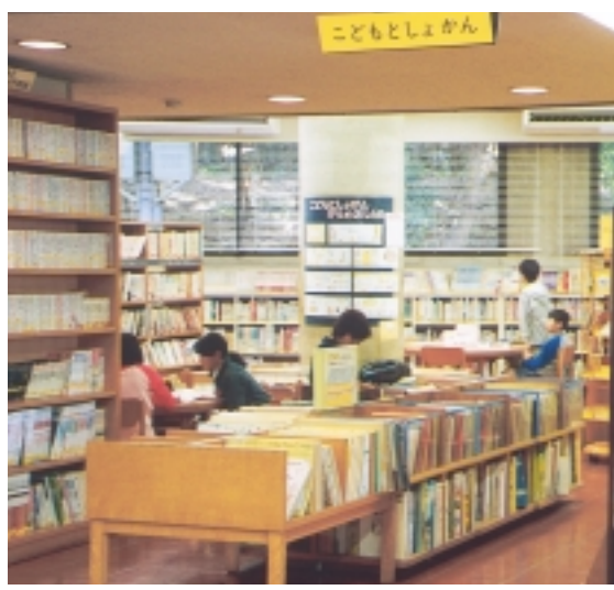
気軽に本と親しもう

一歳六カ月の子はブックスタートから そんなふれあいをつくるために、市では5月からブックスタート事業を行っています。これは、一歳六カ月児健康診査のとき、親子に絵本と、お薦めの絵本リストや図書カードの申込書などをセットにしたブック