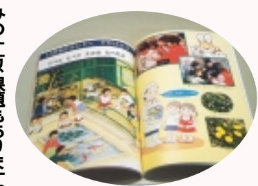
生活科の教科書から

飼育活動の始まりは学校にあって、PTAから飼育小屋の整備を受けた学校が、飼育員を中心に活動を行っています。しかし、学校単位の意義の活動であったことが、動物の飼育に好対症な方、動物、他市では増えつつあるウサギを飼育する学校が増えています。また、PTAから飼育小屋の整備を受けた学校が、飼育員を中心に活動を行っています。しかし、学校単位の意義の活動であったことが、動物の飼育に好対症な方、動物、他市では増えつつあるウサギを飼育する学校が増えています。