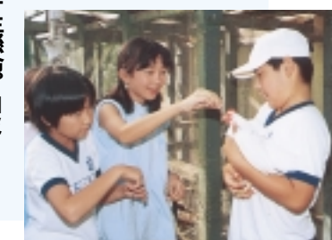
前回は歴代変わらぬロミオです。ジュリエットはこの夏産んだ三頭の卵の孵化に生懸命、ロミオもこのまま産卵がないうまま、盛んに鳴いていました。その後産卵の卵はかえり、子どもたちも楽しみにしている。

こちら土南部小はクジャクを飼っていることで有名。昭和53年の初代校長が知人からヒナを譲り受けたのが最初だそう。以来、亡くなったり野犬に食べられたりしたこともあったそうですが、勝浦市にあった川アイランドからヒナをもらってきて飼育を続けてきました。現在はかえり、子どもたちも楽しみにしている。この名を「ロミオ」と「ジュリエット」。この名前は「ロミオとジュリエット」。