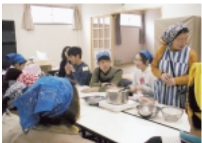
ベガサスでの料理教室