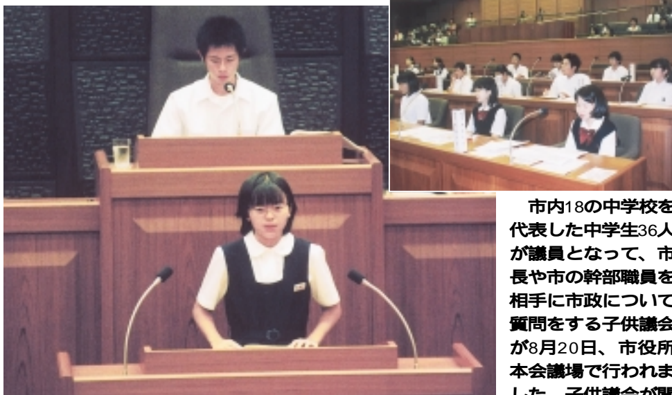
市内18の中学校を代表した中学生36人が議員となって、市長や市の幹部職員を相手に市政について質問をする子供議会が8月20日、市役所本会議場で行われました。子供議会が開かれたのは、昭和44年以来33年ぶり。中学生とはいえ、環境問題や教育問題、柏駅の国際化など、大人顔負けの質問に、答弁する側も真剣そのもの。「時間がないので、答弁は手短にお願します」との発言に、場内からは笑いがこぼれる場面も。将来、この中から市議会議員になる子が出るか楽しみです。