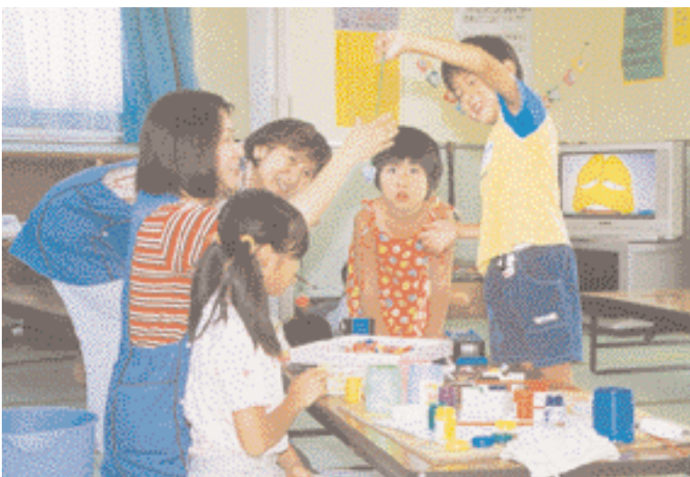
こどもルームの拡充で学童保育の充実を

柏市国民健康保険条例の一部を改正する条例の施行による字の区域と名称 柏市計画事業豊四季駅南口特定土地区画整理事業の施行による字の区域と名称