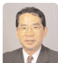
9月市議会市政報告 柏市長 本多 晃

住民基本台帳ネットワークシステム 8月5日からの全国規模による運用開始に合わせ、柏市もこの住民基本台帳ネットワークへ接続し、本人確認情報の提供と利用を始