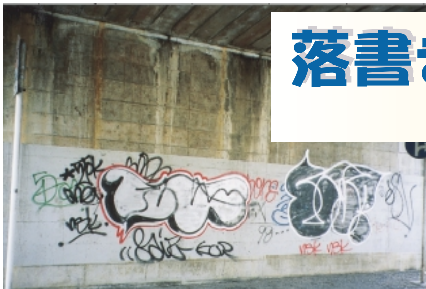
街のいたるところに落書きが...

ビルの外壁や商店のシャッター、公園の遊具など、街のいたるところにかきつけられた落書き。一部に心ない人々による落書きに、不快感や憤りを感ずる方が多いと思います。落書きの放置は犯罪を助長すると言われています。市では、私たちが暮らす街を犯罪のない住みよい街にするため、市民のボランティアのかたにも落書きの防止に取り組まれました。