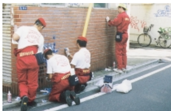
「落書きやめさせ隊」が街をきれいに

そして、この安全・安心キャンペーンの一環として、10月14日には、「落書きやめさせ隊」を発足させ、早速、柏駅周辺の落書きを消して回りました。