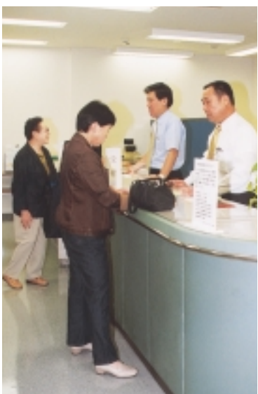
柏駅行政サービスセンターでも受け取れて便利

近隣センターで行う場合 とき 10月21日(日)～27日(土) 午前8時半～午後5時