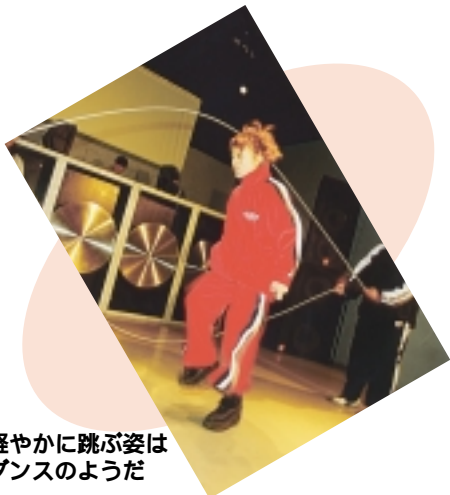
軽やかに跳ぶ姿はダンスのようだ