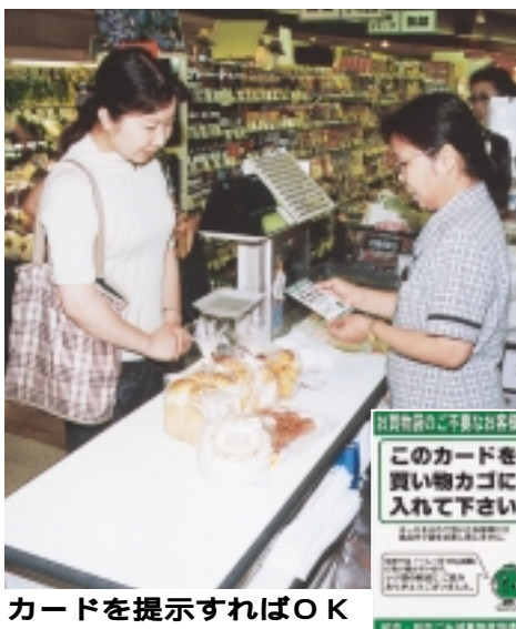
カードを提示すればOK

買い物をする時、無料でもらえるレジ袋。とても便利なものですが、ただでもらえても作るのはただではありません。また、レジ袋は、環境にやさしいものではないと、市民の意識も高まっています。このため、市内5店舗でモデル事業を行います。 レジ袋を減らすには、買い物をするときにレジ袋を減らすことが大切です。レジ袋を減らすには、買い物をするときにレジ袋を減らすことが大切です。レジ袋を減らすには、買い物をするときにレジ袋を減らすことが大切です。