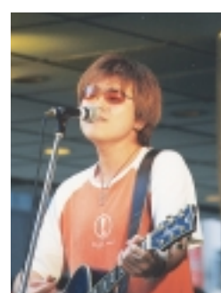
昨年のオーディションから