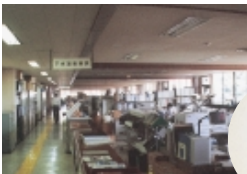
昼休みは消灯をしています

環境への負担を減らそうを定め、それに向かって全職員に対する研修を行うなどして、全庁一丸となつて取り組みました。こうした取り組みに対する内部監査を経て、延べ五日間にわたる登録審査の結果、今年の3月にISO14001の認証を受けることができました。