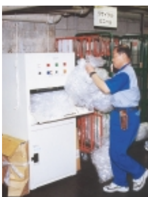
PETボトル圧縮機が運搬を楽にします