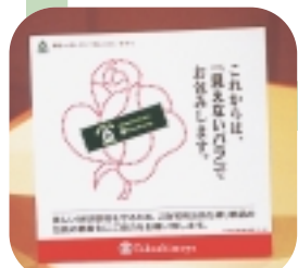
お客様に簡易包装の協力をお願いするプレート