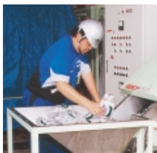
ペットボトルをチップ化してリサイクル

スチール缶・ガラス・段ボールは再びそれらの原材料に、ペットボトルはチップ化して文具や洋服などに生まれ変わります。