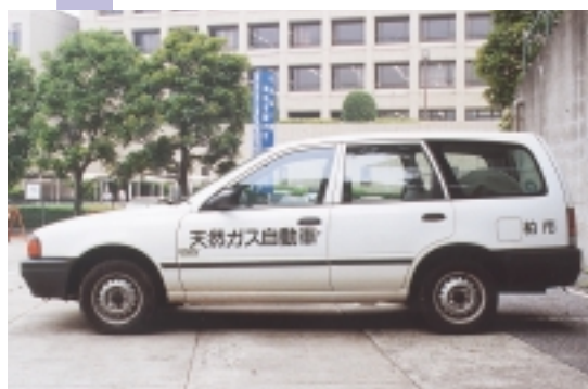
ガソリン車よりも排ガスがきれいです

また、環境への負担を少しでも軽くするための取り組みも行っています。両面コピーの徹底やミニコピーの防止による紙使用量の削減、古紙配合率100%の再生紙の使用、環境に配慮した製品の購入、低公害車の導入、ノーカーデー、ノー残業デーの徹底などです。そのほか、冷房は室温が二十九度を超えないと入れない、暖房は十九度を下回らない