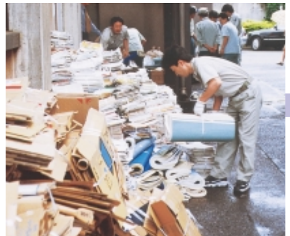
月に2回、資源回収をしています