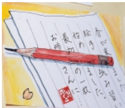
柏郵便局「絵手紙コンテスト」から

季節のあいさつ状などで、定期的な文章が印刷されているだけなのは少々興ざめた。たとえ心と言ふた言葉でも言葉が添えられているのは、相手のことを思う時間を持った表れだから。言葉だけでなく、工夫を凝らしたデザインでもいい。何もメッセージ性がない手紙は、あまり「ふみ