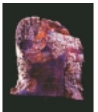
花野井大塚古墳出土短甲鉄製の甲冑(かつちゅう)