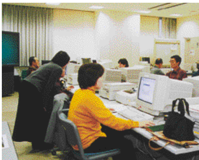
インターネットを利用するかたが増えています

今後利用したい(利用を続けた)ものについては、現在、情報の伝達手段として利用している媒体について、