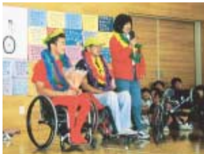
車いすバスケットの選手と学校訪問。ほかに講演会などの活動もある(3月31日には教育福祉会館で開催予定)