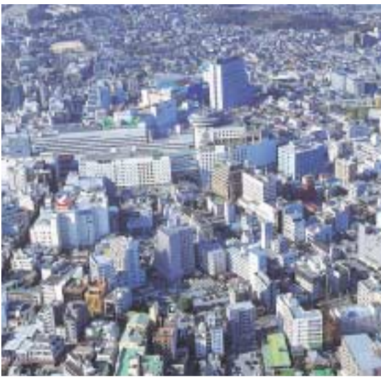
安心して住み続けられるまちを目指して

一つ目は、「すべての市民が尊重され、生涯にわたって安全かつ快適で、安心して住み続けることのできるまちづくり(安心)」、二つ目は、「だれもが充実して暮らすことのできる、多様な魅力と活力のあるまちづくり(希望)」、三つ目は、「市民がま