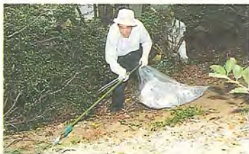
特製の熊手が活躍

1時間ほど作業をすると、あっという間にゴミ袋がいっぱいになります。「市の清掃も週1回来ています。でも、公園はここだけではないし、細かいところまではやりきれないですよ」と