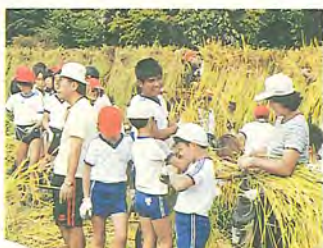
下田の森で稲刈りを体験

公園で遊んだら、必ずごみを持ち帰る。それももちろん大切なことですが、そのとき、落ちていた缶を一つ、拾ってみませんか。そして仲間や友達にひと声かけて、ときにはみんなで集めてみませんか。