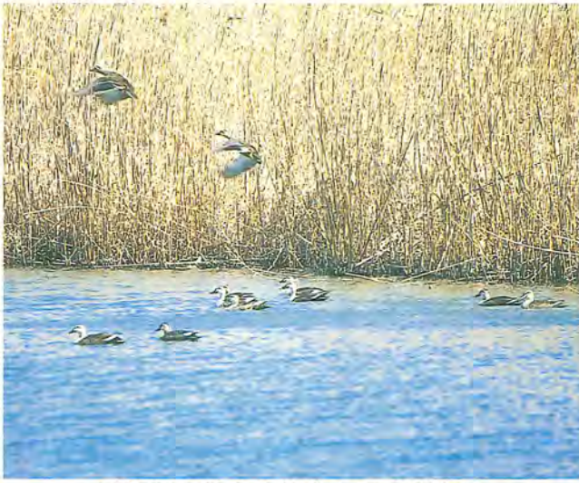
手賀沼の魅力を紹介してください

あなたのとっておきの場所「手賀沼八景」を募集します。柏市・我孫子市・沼南町では、手賀沼のある風景を21世紀「手賀沼」を募集します。