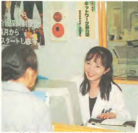
協力員があなたの相談にお応えします

薬剤師六十人が、薬剤師としての専門的な知識と、日ごろ、地域のかたのかけつけ薬局として親しまれている経験を生かし、介護の相談協力員として、皆さんの介護に関する相談に応じます。 相談協力員は、寝たきりなど、介護が必要なかたを抱える家族から、介護保険のサービス内容や、申請する書類の書き方、介護用品などの相談を受けると、市内に七カ所ある在宅介護支援センターや市の窓口へ取り次ぎます。 また、介護保険の内容に限らず、市で行っているさまざまな福祉サービスについても紹介します。