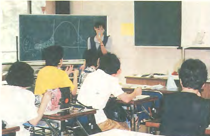
市の職員がネットワーカーとして会場へ伺います