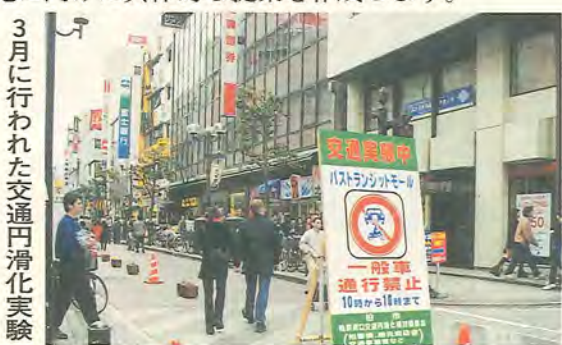
3月に行われた交通円滑化実験

柏駅東口交通円滑化方策調査(900万円) →柏駅東口地区の交通円滑化方策として、交通実験(平成11年度実施)の結果を分析・評価し、実施に向けた具体的な提案を作成します。