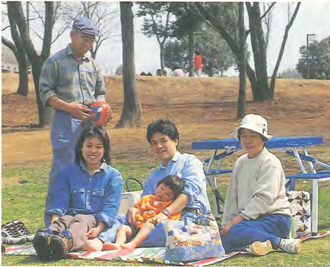
だれもが暮らしやすい街を目指して