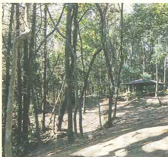
豊かな自然が残る増尾城址総合公園

情報教育の充実(二億二百六十万円) 市政への理解を深めてもらうため、要望に応じて市職員等が講師として出向き、市の施策や事業を説明します。