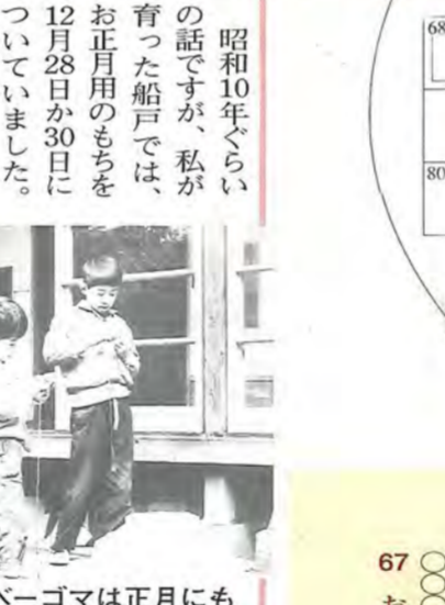
当時人気のベゴマは正月にも