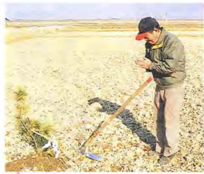
一畝で豊作を神様に祈ります

新しい年の野良仕事は「イチクワ(二鍬)」という行事で始められます。農家の仕事始めにあたり、1月11日の朝早く行われます。松とじり縄