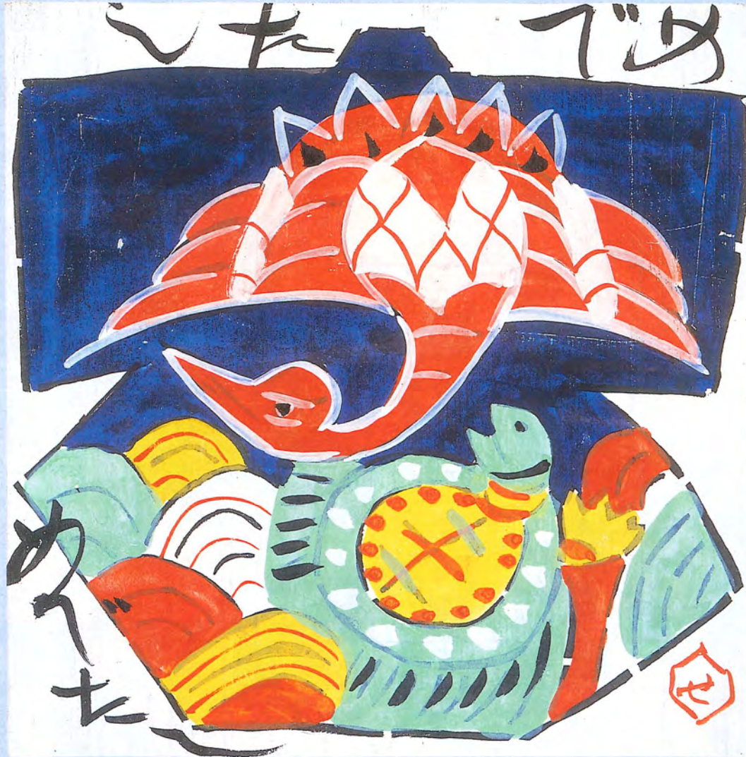
板絵「めでたしめでたし」