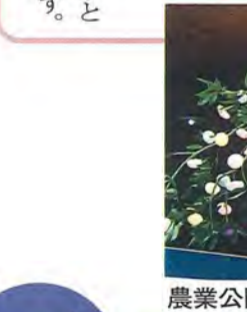
農業公園まつりで展示されたまゆだま

クロスワードパズルの同じ色のマスと並べて、3つの言葉にしてください。さて、共通している漢字は何でしょう。