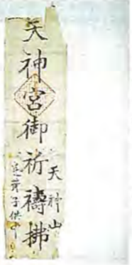
天神講で配られたお札