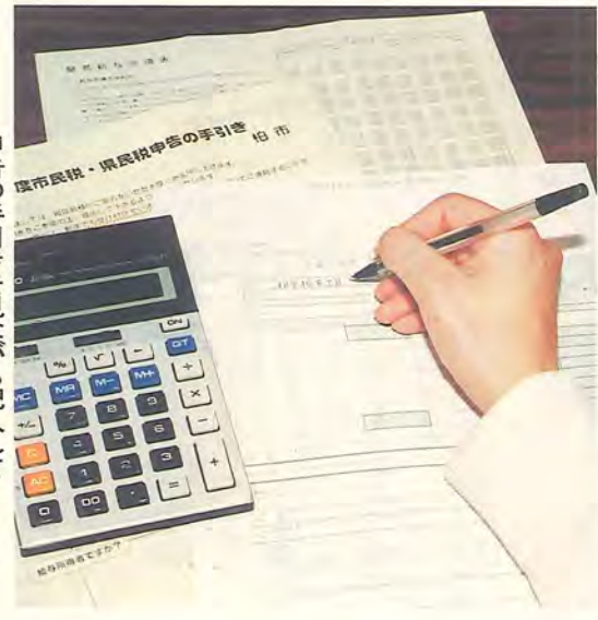
申告の手引きを見ながら記入して