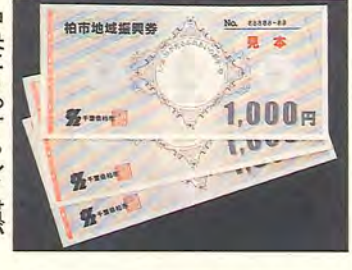
中央にうっすらレイ君が

転出・転入をするかたは、その異動日によって地域振興券を交付する市町村が変わります(①～④参照)。 なお、転入の届け出は、新しい住所に住んだ日から十四日以内にお出してください。遅れると、地域振興券の交付ができない場合があります。