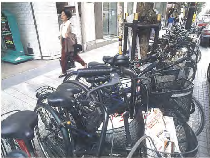
道路は自転車置き場ではありません

千葉県条例では、歩道の幅は、二メートル以上必要とされています。「何げなく置いた自転車により、たぐさんの自転車が道路や歩道に置かれたが困っているのです。」