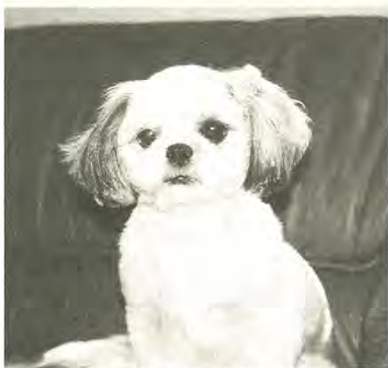
悲しい思いはしたくないワン!

市では、ペットと地域の人たちが安心して暮らせる社会を作るために、「ペットを愛する市民の懇談会」を設置し、