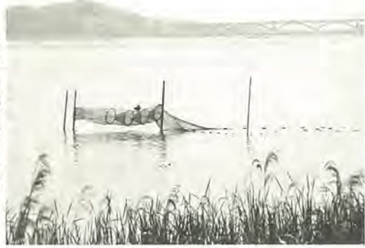
貴重な自然が残る手賀沼

昨年まで柏市では、9月を生活排水月間として生活排水対策を進めてきました。今年から、千葉県と手賀沼流域の自治体で構成する「手賀沼浄化事業連絡会議」が、新たに