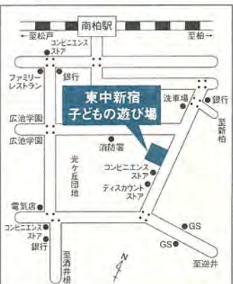
図 柏市みどりの基金 ☎60-3120

花・植木の販売。緑の相談コーナー(10日)、レンゲツツジの苗木の配布(10日午後1時から)、シバザクラの苗の配布(11日午後1時から)