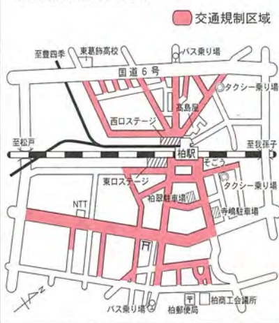
図 柏まつり実行委員会 ☎62-3315