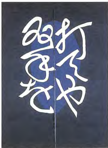
打てや双手を文のれん (1975年)

「芥沢銈介」のれん展」 9月6日(日)までの午前9時半〜午後5時(入館は午後4時半まで) ※休館日は月曜日(祝日・休日)の場合は翌日