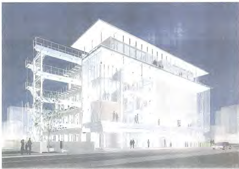
オープンが待たれる、文化・芸術の発信拠点

立地条件は、JR柏駅から徒歩五分と恵まれています。利用者の生き生きとした活動が外からでもわかるように、道路に面した部分や館内のエレベーターをガラス張りにしました。また、公民館・近隣センター・多目的ホールの三つの施設が一体となり、建物の中心に吹き抜けがあり、開放的で明るく都市空間にマッ