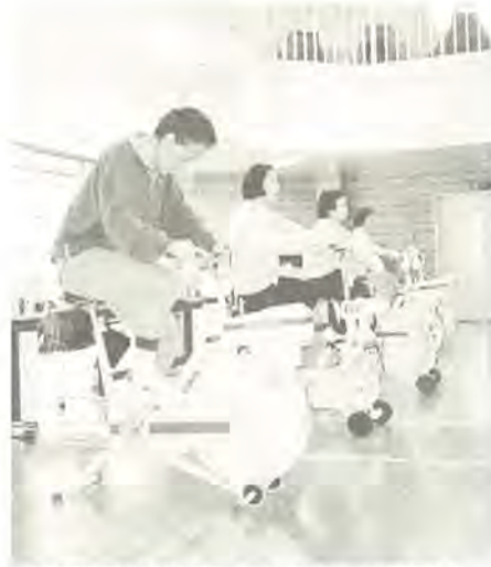
専門家の指導で安心して運動を

「運動不足なので、体を動かしたい。でも、いきなり始めて大丈夫だろうか。こんな悩みを持っているかたはいませんか。」