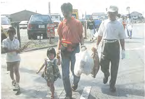
家族そろって参加しよう

ゴミゼロ運動への参加をきっかけに、ご家族でもう一度、環境問題について考えてみてくださいますようお願いいたします。