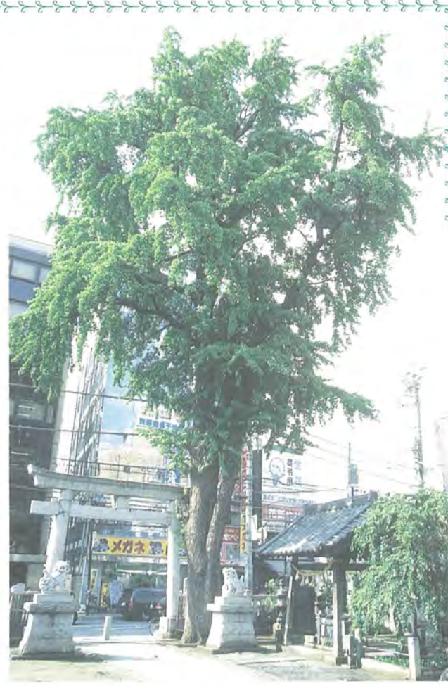
柏駅前ビッグツリー