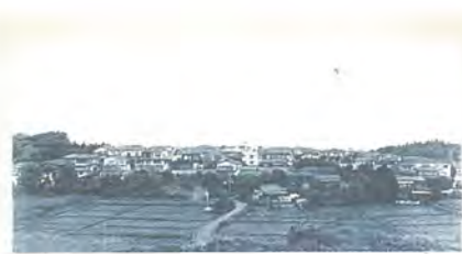
日記 1987年9月22日 柏市亀甲台