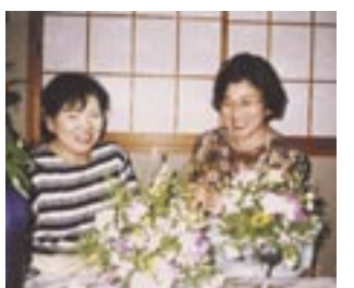
華道の師範として48年間指導している

は子どもの時から」。カルシウムをとるために、魚を食べた後はその骨を焼いて食べていた。「父親の影響で、今でもよい歯を保つ習慣を続けています」。