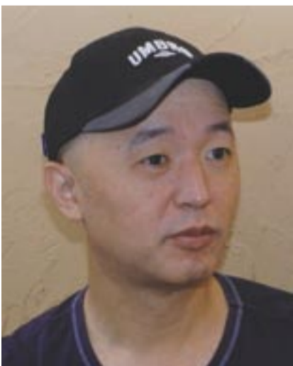
柏一小100周年記念歌を作る