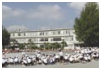
100周年を迎える柏一小。生徒数1,021人(5月1日現在)

市の人口 (19.9.1 現在) 388,187人(前月比428人増) 男 193,259人 女 194,928人 150,662世帯(前月比310世帯増)