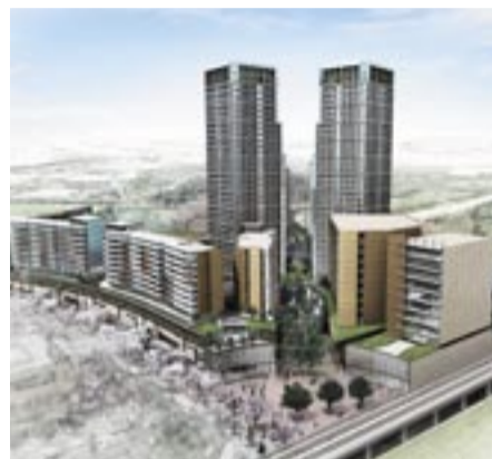
平成23年に完成予定の柏の葉キャンパス駅(西口)の整備イメージ図