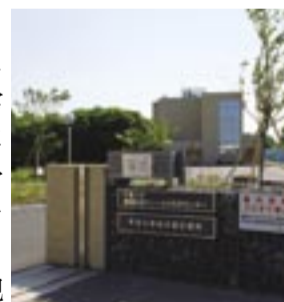
予防医学センターが入る千葉大学の葉キャンパス

市の人口 (19.6.1 現在) 387,575人(前月比309人増) 男 192,959人 女 194,616人 150,215世帯(前月比963世帯増)