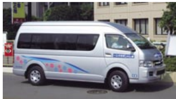
平成17年9月から運行している乗合タクシー

駅東口の駅前広場に乗り入れられます。東口にはエレベーターも設置されていますので、高齢者やベビーカーを利用する方などにも優しい出入り口となっています。時刻表や停留所など、詳しくは市のホームページ(アドレスは一面欄外)か染谷交通(☎7164-1919)にお問い合わせください。なお、既存バス停の時刻は変更あり