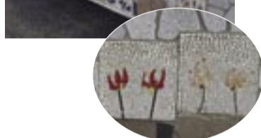
モザイク模様のエコ平板