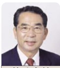
施政方針 柏市長 本多 晃

3月の定例議会に提出した、平成19年度の予算案は、合併関連事業、子育て支援、健康づくり、子ども安全対策、防災対策を昨年度に引き続き重点課題に取り上げ、編成しました。これに加えて、現在取り組んでいる行政改革の方向を反映するよう経費の節減と財政構造の改善を図りました。 その結果一般会計の規模では、18年度に比べて1・0%減(実質1・4%増)の緊縮型になりました。