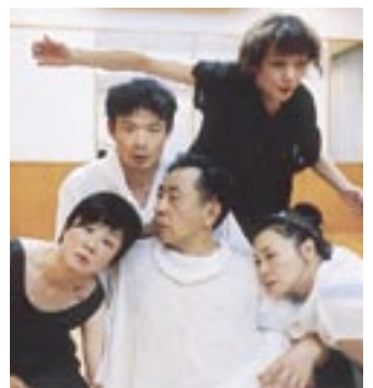
新たな表現を追求し、熱心にけいこに取り組む

活躍してきた35年間の体験が見てとれる。11月から常磐線のイメージアップを図るJOBANアートラインプロジェクト柏が市内各所で始まる(1面記事参照)。このイベントの一つが錬肉工房の「月光の遠近法・抄」。