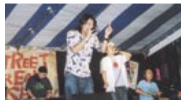
昨年の決勝大会から

今年で9回目を迎えるミュージック&パフォーマンスコンテスト「STREET BREAK」(ストリートブレイク)の決勝大会。厳しい予選を通過した14組のミュージシャンで争われる、ハイレベルなパフォーマンスをご覧ください。