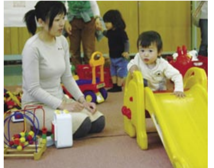
子育てしやすい環境を市がサポート