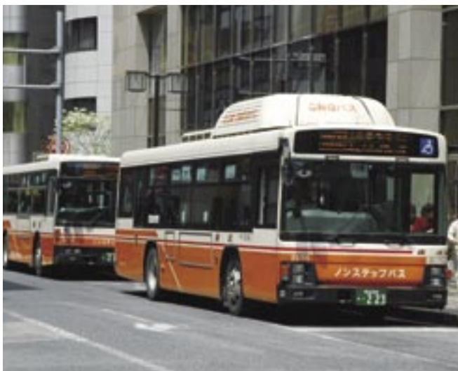
より充実したバス交通網を目指して

市の重点施策や市民の皆さんの関心が高い市の事業等について、パブリックコメントやアンケート方式により、幅広く皆さんからご意見をいただく新しい市政モニターを始めます。最初のテーマは、「バス交通網の整備計画案」。身近な交通機関であるバス交通について、市民を交えて今後の整備計画をまとめました。たくさんのご意見を募集します。