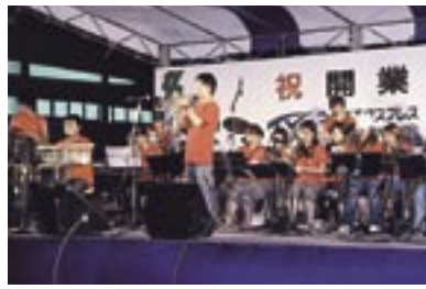
会場を盛り上げた市柏吹奏楽部OB「BELL'Z」のコンサート