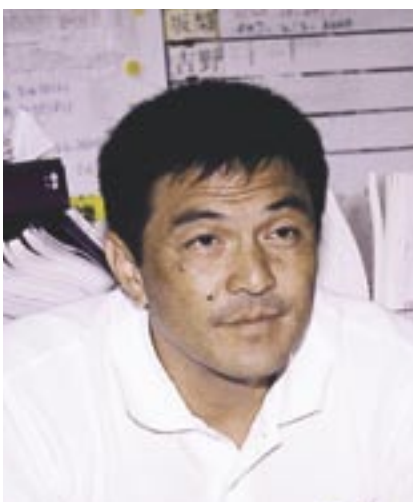
高校総体ベスト8入りした市立柏高校男子バスケットボール部監督