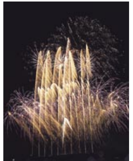
8分間で2,000発が打ち上げられた花火ファンタジア