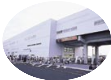
記念イベントが行われた柏の葉キャンパス駅

そして待ちに待った開業日当日。柏たなか駅に一番列車が入線してくると、劇的なこの瞬間を一目見ようと早朝から鉄道ファンや多くの見物客がカメラを構えて電車を祝福。停車して扉が開くと大きな歓声と拍手が駅構内に響き渡りました。