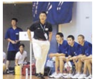
試合中も容赦なくげきを飛ばす

市の人口 (17.8.1 現在) 381,078人 (前月比23人増) 146,598世帯 (前月比34世帯減)