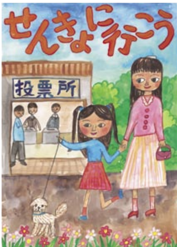
明るい選挙啓発ポスター 寺前 有海さん(旭東小)の作品