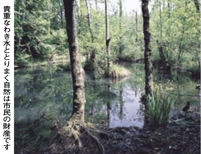
貴重なわき水ととりまく自然は市民の財産です

平成15年11月に学識経験者や周辺施設関係者、自然保護団体、市民委員などによる「こんぶくろ池公園環境創造会議」を設置しました。そこで、公園づくりに向けた詳細な検討を行い、具体的な保全計画や整備計画、管理方針などを定めた基本計画がまとまりました。計画では、こんぶくろ池と弁天池の二つの貴重な