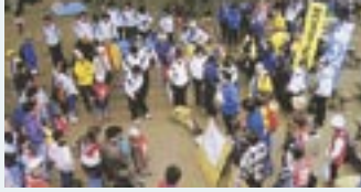
5月15日に行われた柏市レクリエーション協会による「全国一斉遊びの日～手賀沼ふれあいサイクリングキャンプ」

合併から、2カ月。新市住民の交流などを目的として、市民の皆さんが企画・実施する合併記念事業が市内各所で行われています。予定されている事業は13で、5月までに2つの事業が行われました。7月～9月に行われる事業は別表のとおりです。ぜひご来場ください。