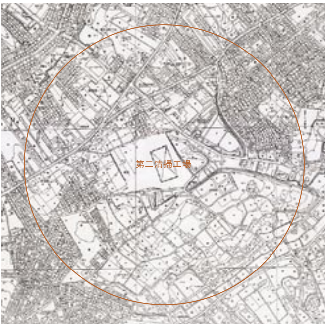
■第二清掃工場の建物の中心から500メートルの円

苦情があった場合、市からの求めに応じて意見を述べる 任期7月末ごろからの2年間 報酬なし 申し込みはがきに「柏市第二清掃工場臭気モニター希望」と明記し、住所・氏名・生年月日・職業・電話番号を書いて、〒277-8505 柏市役所環境施設課へ、6月30日(木)までに郵送で(当日消印有効) ☎環境施設課 ☎7167-1140