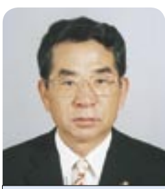
市政報告 柏市長 本多 晃