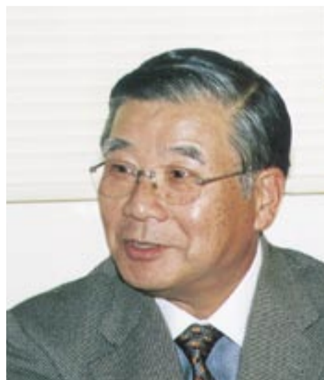
江戸末期の母屋などを市に遺贈