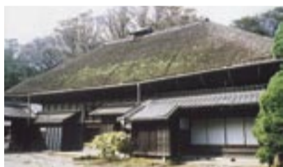
江戸末期から続く吉田家の母屋

新潟中越地震義援金を募集します。10月23日に発生した新潟県中越地震。市では被災地のかたへの義援金を市民の皆さんから受け付けています。12月7日現在で、寄せられた義援金の総額は四百九十九万四千五百一円になりました。ご協力ありがとうございました。