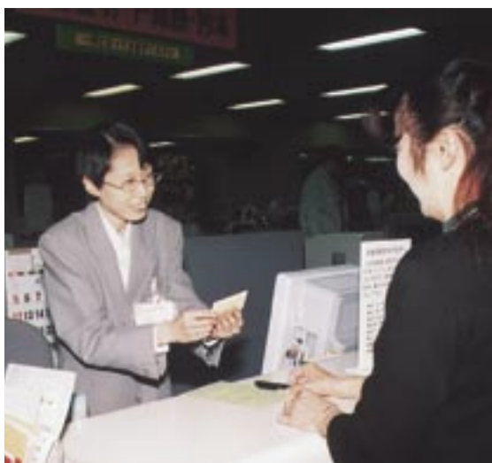
窓口では身分証明書で本人確認をします

最近、本人が知らない間、などの戸籍の届け出や転入に、本人になりすました第三者が、住民票の写しなどの証明書を不正に取得する事件が発生しています。これまでも市では婚姻届