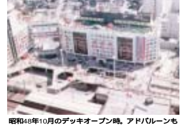
昭和48年10月のデッキオープン時。アドバレーンも

編集後記 108年前、もし柏駅がなかったら、今日の柏の街の繁栄はなかったかもしれません。実は常磐線の計画時点では、柏を回るルートも検討されていたそうです。幸運にも田畑や牧場ばかりの未開の地に柏駅がつけられたこと、野田からの貨物輸送線が常磐線に接続するために柏まで引かれたこと、交通の要衝としての柏の発展はこのときに運命付けられていたのかもしれない。しかし、このチャンスを確実に生かして街を発展させてきた原動力は、いつの時代でも「市民の強い力」であったことは間違いありません。次回の50年の始まりの年、つくばエクスプレスが開業します。新鉄道は私たちに果たしてどんな夢を乗せてきてくれるのでしょうか。