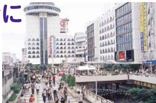
あなたは永住派?それとも...