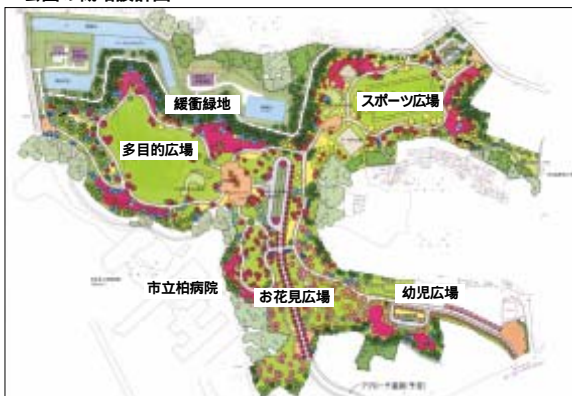
公園の概略設計図

公園の面積は、漫出水処理施設や事務所などの管理施設に必要な面積を除く約八・三ヘクタールとなります。