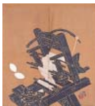
機はた文のれん(株)すずや所蔵

とき 5月23日(日)~9月5日(日)午前9時半~午後5時(入館は午後4時半まで) 月曜日(月曜日が祝日または振替休日の場合はその翌日)を除く。5月17日(月)~22日(土)は展示替えのため休館 入館料 一般310円、高校・大学生150円、小・中学生100円 障害者・70歳以上のかたは無料。6月15日(火)の県民の日は無料