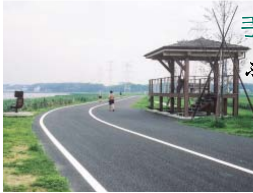
手賀沼の自然をたっぷり楽しんでみては

飛来する水鳥 ヨシ原や沼南町のハス群生地、流れ込む大堀川・大津川など市民の皆さんが身近に自然と親しめる貴重な場となっている手賀沼。昨年には、昭和49年以来二十七年間続いていた「日本一汚れた沼」の汚名を返上しました。 この水質浄化に一役買ったのが北千葉導水路です。利根川の水を江戸川へ送る際に、手賀沼へ注入することで水質改善に大きな威力を発揮しました。 現在、この北千葉導水路