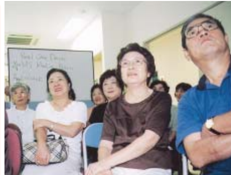
ほのぼのプラザの講座で新しい楽しみを(写真はパソコン講座でスクリーンを見ながら説明を聞く参加者)

と き 10月1日~来年2月18日の第1・第3水曜日午前10時~正午(計10回) 対 象 市内在住で60歳以上のかた、15人 内 容 自分史を書く心構えから和綴(と)じ製本作業までを学びます 費 用 無料 用 意 ノート、筆記用具 申 込 往復はがきに「自分史作成講座希望」と明記し、住所・氏名・年齢・電話番号と返信面をあて先を書いて、〒277 0051加賀3丁目16 8 ほのぼのプラザまそおへ、9月15日(月)までに郵送で(必着) 応募者多数の場合は抽選