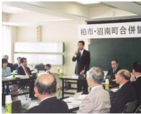
7月11日の第1回協議会では会議の運営規程や今後の協議の進め方などを決めました

現在、合併後の新たなまちづくりの計画となる「新市建設計画」を作成するため協議を進めています。