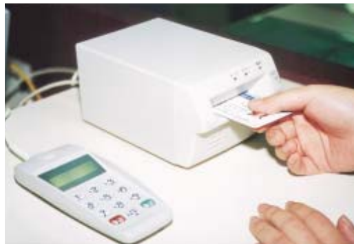
住基カードを使うときには、自分しか知らないパスワードを入力

現在、住民票の写しは、住んでいる市区町村や限られた市区町村だけでしか取れませんが、8月25日(月)からは、全国の市区町村で取れるようになります。住民票の写しに記載されるのは、氏名・生年月日・性別・住所の四項目で、申請するとき本人が希望すれば、住民票コードや続柄を記載することがあります。手数料は市区町村によって異なりますが柏市の場合