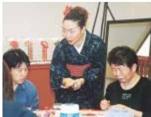
江戸つまみかんざし職人(右)の技をお客さんに解説。6月19日からは房州うちわ展を開催する

かしわおどりはヨ～、でおなじみ、夏の定番かしわ踊り。この振り付けをマスターしようと、6月1日、ほのぼのプラザますおでかしわ踊り講座が開かれました。参加した14人のかたは「ずっと柏に住んでいて、歌は知っているのに、踊りは…」という初心者者がほとんど。それでも熱心な講師の指導に、1時間ほどで皆さんマスターしました。「この夏は地域の盆踊りで踊りたいわ」と意欲まんまんになっていました。