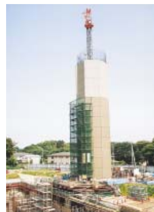
周辺環境に配慮し工事を進めている第二清掃工場(中央は煙突部分)

平成17年3月の完成を目ざして工事が進められている。特にダイオキシン類に関する第二清掃工場。市では市民参画のもと、平成9年度から環境アセスメント調査し、松葉による補充調査を行っている。 行ってきまして、ダイオキシン類の調査や検討委員会などを通して、市民の皆さんにご理解と協力をいただけるよう努めています。 第二清掃工場の稼働に伴うダイオキシン類の健康への影響を検証するため、検討委員会を設置します。メンバーは学識経験者、地元町会・自治会等の代表者、公募委員で構成します。 平成16年3月までに、四回程度の委員会を開き、調査方法等の実施計画案に対する評価等をしていただきます。 今後、検討結果を踏まえ、今回、この検討委員会の公募による委員を次のとおり募集します。 対象 市内在住で20歳以上のかた、二人 申し込み はがきに「健康影響調査検討委員希望」と明記し、住所・氏名(ふりがな)・性別・生年月日・職業・電話番号・応募の動機を書いて、〒277-8505 柏市役所清掃工場建設課へ、6月30日(月)までに郵送で(必着) 応募者多数の場合は抽選 間清掃工場建設課 7167 1140