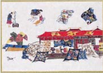
沖縄風物・形附(かたつけ)屋

糊(のり)置き、色差し、張場、洗い場、反物、風呂敷と作業の流れを1画面で表して、紅型を学んだ形附屋の印象を鮮やかに伝えている。