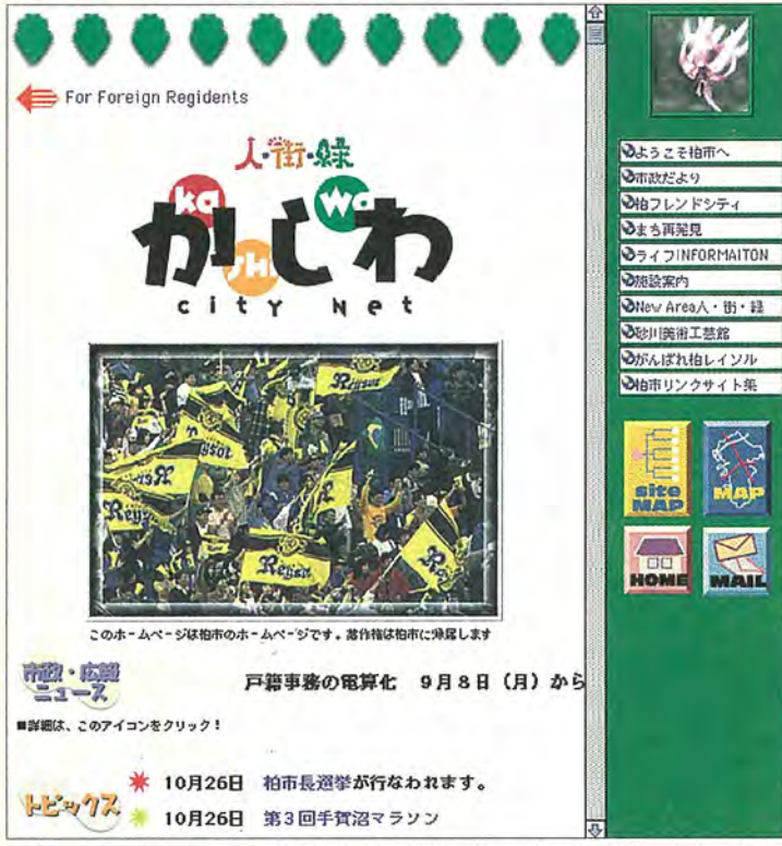
このホームページは柏市のホームページです。著作権は柏市に帰属します。戸籍事務の電子化 9月8日(月)から

ます。ホームページのアドレスは、 http://www.city.kashiwa.chiba.jp/ です。市民生活に密着した情報を提供し、発信する情報は、防災、健康、福祉など市民生活に深くかかわりのある内容が中心となります。かしわシティネットの主な項目と内容は次のとおりです。◎よろこばる市へ 柏市の