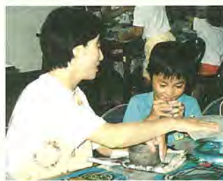
申し込み 7月4日(金) 午前10時から、新田原近隣センターへ費用を添えて

⑮ 夏休み子ども教室 とき 7月22日(火) 午前10時~11時半・23日(水) 午前10時~11時15分 ところ 消費者ルーム(消費生活センター内) 対象 市内在住の小学一年・二年生と保護者、先着十五組 内容 牛乳パックのリサイクル絵本作りほか ☆こみせろ! 主役は君だ! とき 7月29日(火) 午前10時~11時15分 対象 小学四年~小学一年生、先着四十人 内容 野外炊飯・キャンプファイアーほか 費用 四千五百円 申し込み 7月2日(水) 午前9時から、中央公民館へ電話か直接 中央公民館 ☎ 64-1881