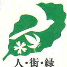
柏市の木：カシワ 鳥：オナガ 花：シバザクラ/カタクリ