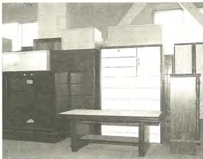
次はあなたのお家で活躍するかも

四月末現在、展示場には、 延べ五千四百三十五人のかた が訪れました。また展示され た家具は、延べ三百二十九点 に上りました。座卓やベビー ダンスなど、小型の家具に希 望が集中するようです。 引越、家の新築・改築 など、まだ使える家具を捨て なければならぬ、という のはよくあること。会場には、 このままごみになってしまうに は惜しいような家具が並んで います。ときには、新品同様 の物が展示されることもあり