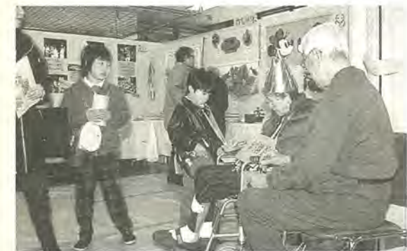
文化事業のひとつ「かしわ葉福祉まつり」

「障害があっても不安や不便さを感じることなく暮らせるようにするには、今の街や仕組みをどのように変えていけばいいのかと