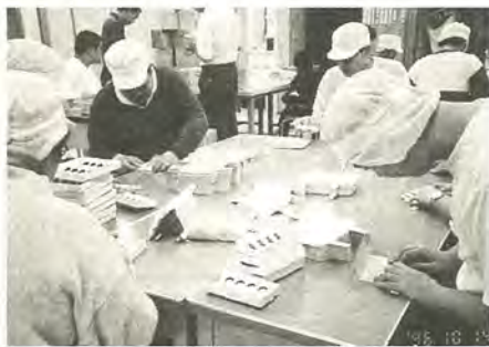
働く場の確保は重要な課題