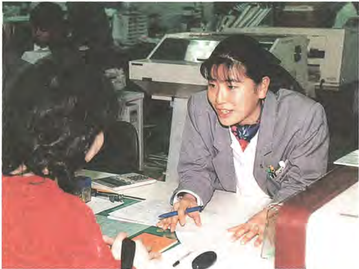
きめこまやかな市民サービスを