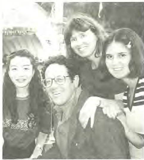
新しい家族もできました

柏市国際交流協会では、今年夏の夏に、姉妹都市「トランス市」(米国カリフォルニア州)へ派遣する青少年を募集します。