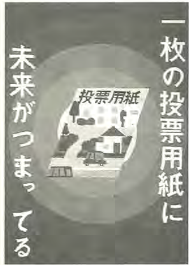
一枚の投票用紙に 未来がつまってる